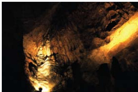
Comblain Au Pont

La grotte de l'abîme est à prédominance verticale. Attendez-vous donc à monter et descendre bon nombre d'escaliers. La visite dure environ 75 minutes et se fait en parcourant des galeries qui débouchent sur des petites salles aux superbes concrétions (stalactites, stalagmites, draperies, fistules, etc.) diversement colorées et particulièrement bien mises en évidence par un éclairage judicieux. Le port du casque n'est pas superflu car le plafond de ces galeries est par endroits assez bas.