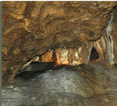
Comblain Au Pont

Fléché à partir du Bureau du Tourisme, Place Leblanc, I à 4170 Comblain-au-Pont.